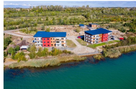
Justizvollzug Seehaus Leipzig

für Schöffinnen und Schöffen aus dem Landgerichtsbezirk Halle , Landgerichtsbezirk Leipzig